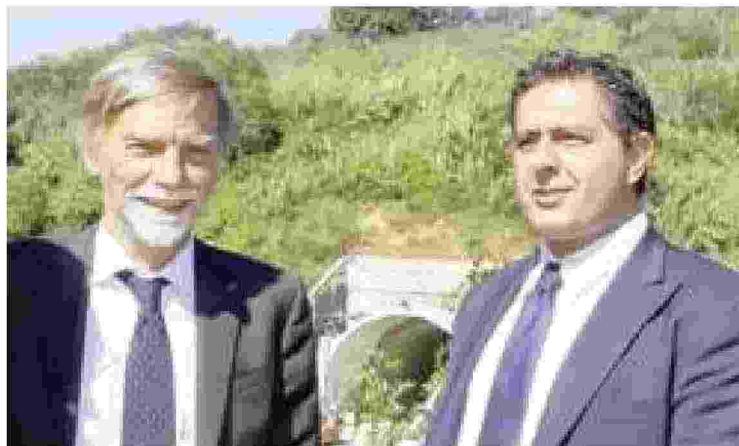
Il ministro Graziano Delrio con Giovanni Toti