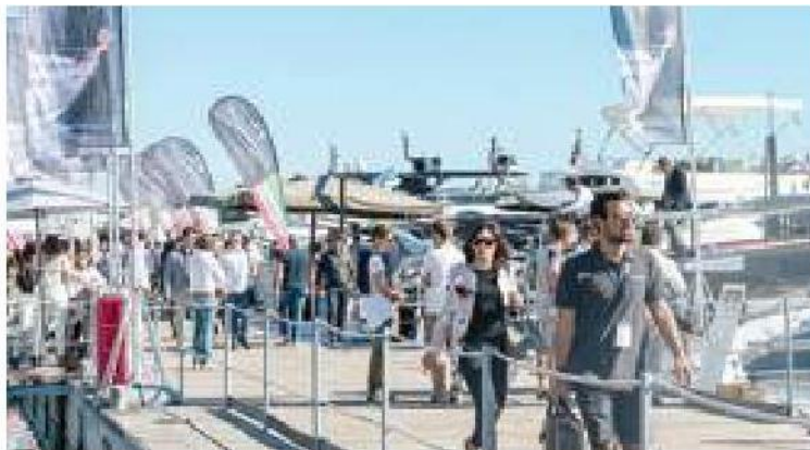
Visitatori del salone passeggiano sui pontili