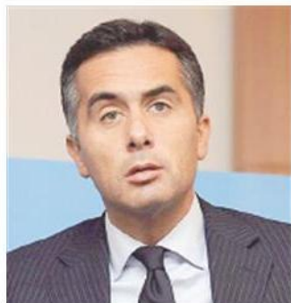
MASSIMILIANO SALINI EURODEPUTATO DI FORZA ITALIA